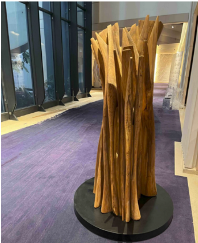
La fantastica scultura in ulivo di Pablo Atchugarry

Il cuore pulsante della creatività internazionale batte in questi giorni a Monaco, dove ha appena aperto le porte ONE MASTERS , salone d'eccellenza dedicato all'arte, alla gioielleria e al design, organizzato da Art and Jewels of the World .