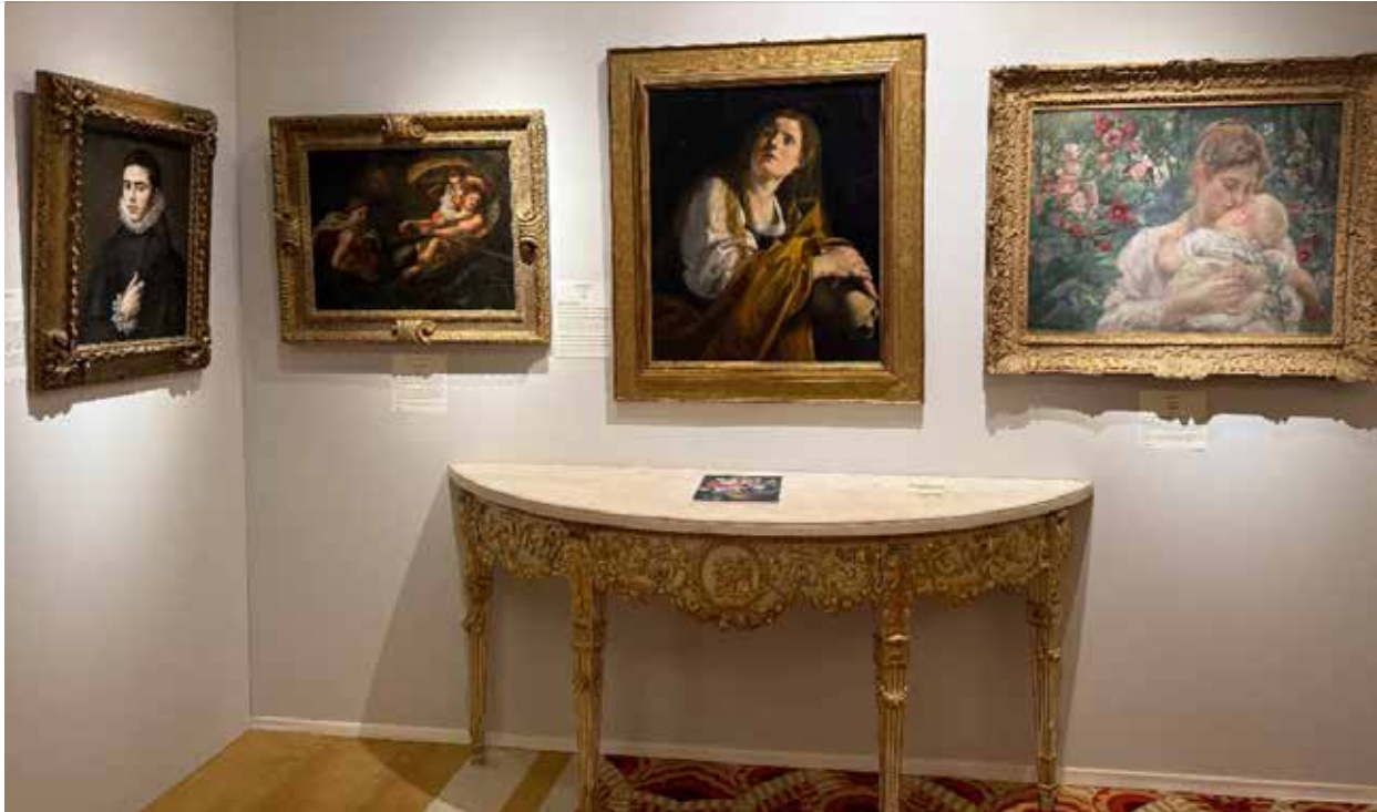
Maison d'Art in One Masters.

The invitation-only event featured 14 galleries, dealers and jewellery houses, creating what Vasileva described as a networking environment for art collectors, professionals and enthusiasts.