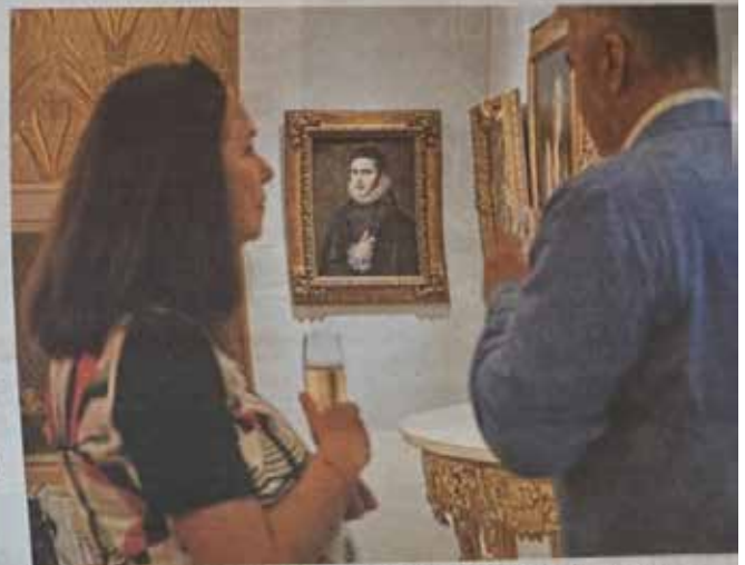
Inauguré mercredi, le salon se poursuit jusqu'à ce vendredi soir.

ONE Masters Monaco au One Monte-Carlo jusqu'au 11 juillet 2025, de 14 heures à 20 heures. Entrée libre